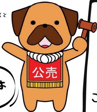
こうちこうばいふるじょくと PRキャラクター 『たかみく』

滞納続等が完納した場合など には、対象物品の公売が中止 (入札無効)となります。