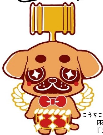
こうちこうばいぷろじえくと PRキャラクター 『このすけ』