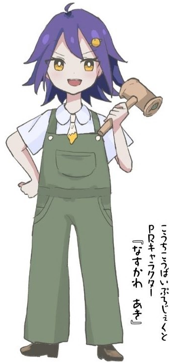
こうちこうばいふるじょくと PRキャラクター 『たかみく』