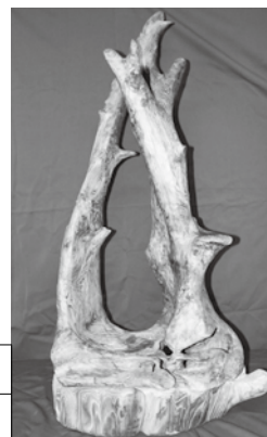
木の置物(大) 3,000 円