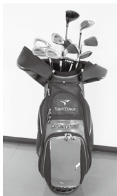
ゴルフクラブ セット 2,000 円