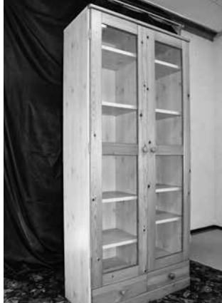
食器棚 1,500 円