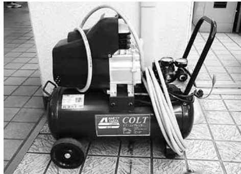
エアークンプレッサー 3,000 円