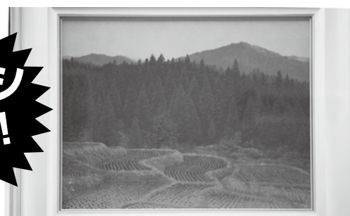
日本画 (田野早旦) 二川和之作 1,500,000 円