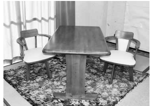
ダイニングテーブルセット 2,000 円 (せり売り)