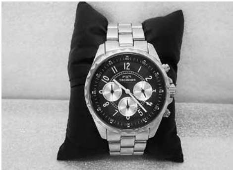
腕時計 3,000 円