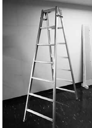
脚立 (大) 1,600 円