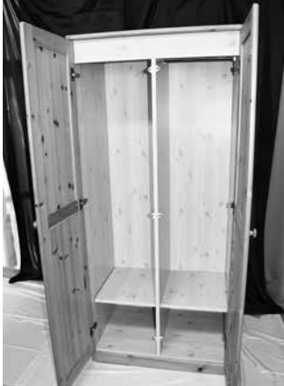
洋服ダンス 2,000 円

★これらの物件は滞納処分による差押物件のため、事情等をご理解のうえで、入札参加をお願いいたします。 ★確認できていない不具合や汚れ、破損等があると思われます。完全なものを求められる方の入札はご遠慮 ください。公売の特殊性等をご理解のうえ、ノークレーム、ノーリターンでの落札をお願いいたします。